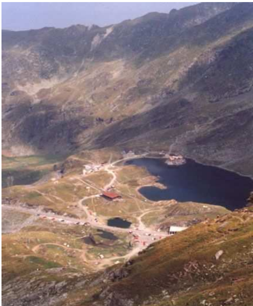
Zona Bîlea Lac / Trans-Făgărășan